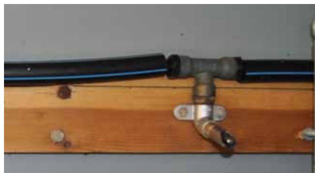
Drikkenipler montert på kompakte plastplater.

Ved montasje må plata ligge flatt og ikke bende. Følger du denne instruksjonen vil platene holde fasongen og du vil ha en slett vegg i mange år.